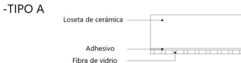
Figura 1: Estratigrafía de baldosa cerámica multicapa tipo A.

Coverlam es una baldosa cerámica multicapa con una capa de refuerzo adherida a la losa cerámica, y está clasificada como tipo A según la descripción en la cláusula 1.1 del EAD 090078-00-0504. Está disponible en diferentes grosores de la losa cerámica (véase la Figura 1).